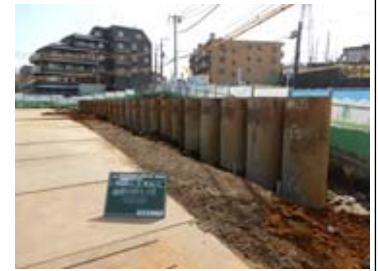
◆鋼管杭工事の完了の様子