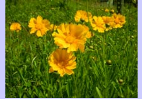
【工事エリアにも春らしい花が咲きました。】