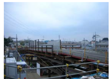
2) 暫定道路整備の様子