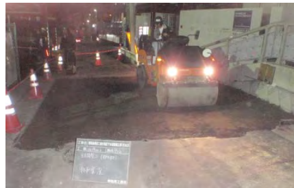
写真① 舗装仮復旧工事

下水管の敷設、立坑の撤去、マンホールの設置が1月までに完了し、現在舗装の仮復旧をしています。3月下旬に、本復旧を行う予定です。