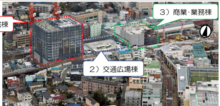
再開発ビル工事(こども自然公園側から望む)

西側工区は6階まで躯体工事が完了し、外装工事を進めています。東側工区では線路側の鉄骨が6階まで組みあがっています。