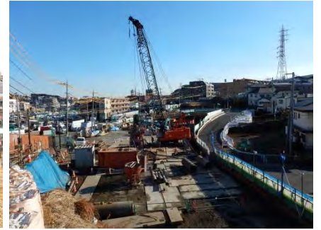
写真② 基礎杭の工事