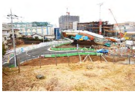
写真① 切り回し後の生活道路