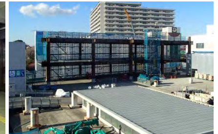
写真② 駅舎増築部鉄骨工事