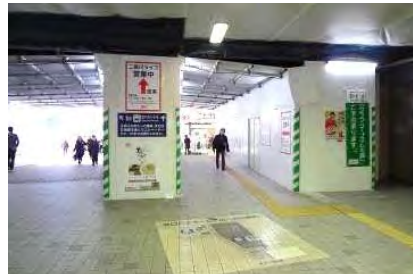
写真① 北口エレベーター付近