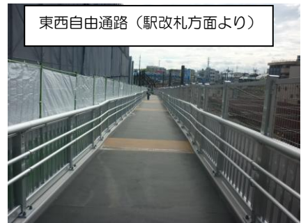
東西自由通路（駅改札方面より）

相鉄線南側の二俣川上部に駅改札階からさちが丘陸橋方面（西側）へと繋がる自由通路（事業主体：相模鉄道株・株相鉄アーバンクリエイツ、施工業者：西松建設・NB建設共同企業体）が整備され、8/8 より供用が開始されました。この通路の一部は仮設供用であるため、住宅棟工事完成後に本設の通路を再開発区域内に整備いたします。